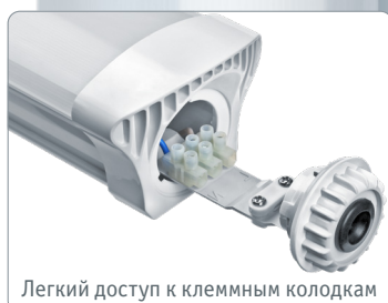
Легкий доступ к клеммным колодкам